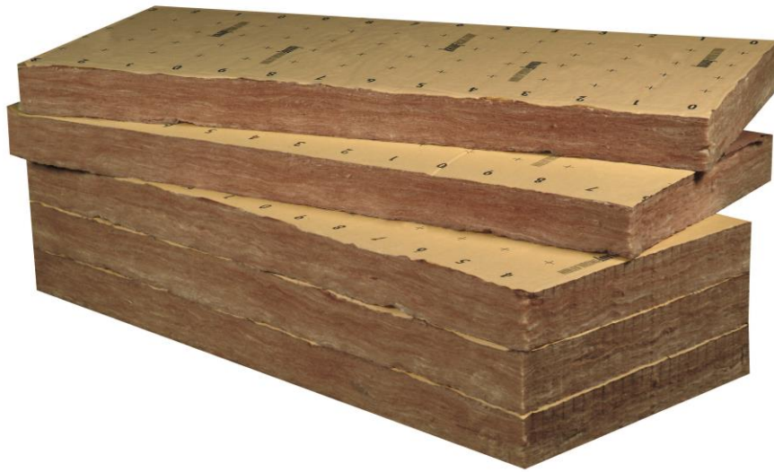
Knauf Insulation laine de verre ECOSE® TP 238 120 mm