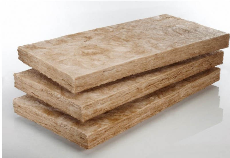
Knauf Insulation laine de verre ECOSE® Ultracoustic P 45 mm