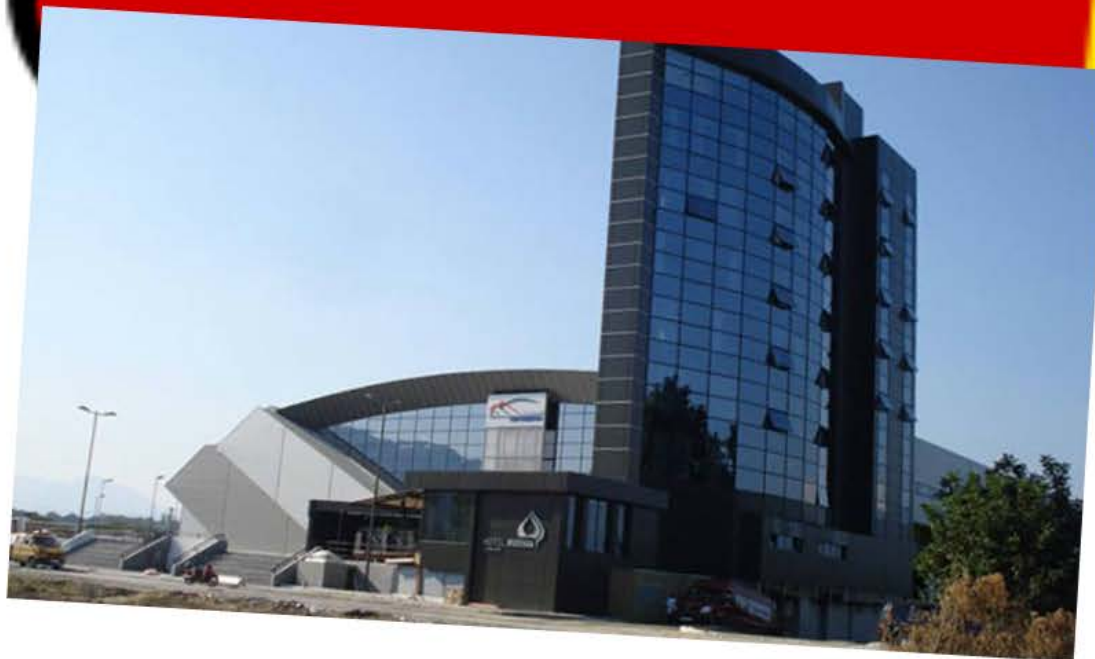
Спортски Центар "Јане Сандански"

Сувомонтажни системи, фасада со камена волна и спортска сала со FE50 самонивелирачка кошулка, како подлога на паркетот.