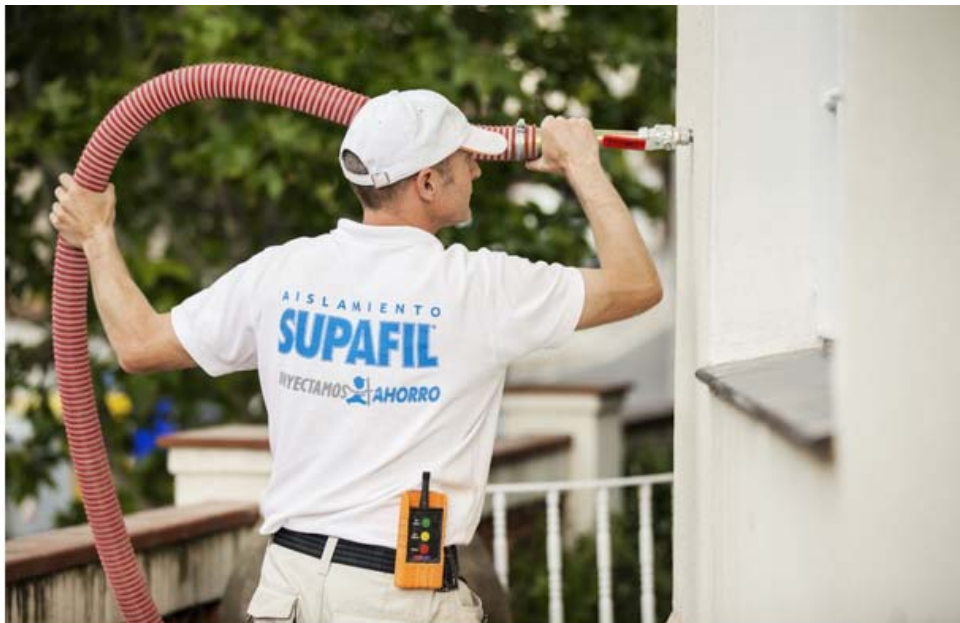
Ejemplo de instalación exterior

Es importante destacar que Knauf Insulation es una multinacional alemana que cuenta con una larga experiencia en la instalación de Supafil, 30 años en el Reino Unido, 15 años en Holanda y 3 años en Francia, Alemania y Bélgica. Knauf Insulation comprometido con la sostenibilidad, ofrece materiales de construcción que mejoran las sostenibilidad y la calidad de vida de las personas. Su Lana Mineral ha sido certificada con la eco-etiqueta tipo I (según ISO 14024) por sus bajas emisiones en COVs (Compuestos orgánicos volátiles), cumpliendo con los requisitos más exigentes sobre Calidad de Aire Interior en los edificios.