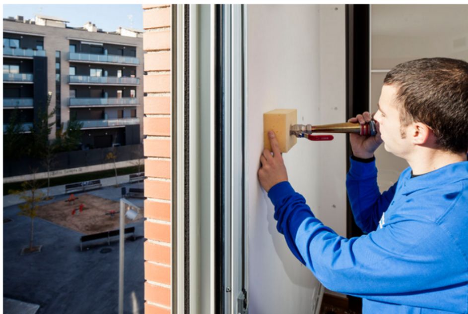
Ejemplo de instalación interior: limpia y rápida